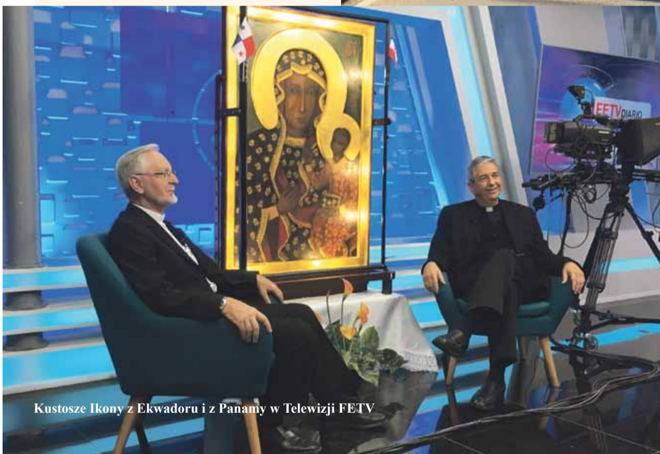
Kustosze Ikony z Ekwadoru i z Panamy w Telewizji FETV

pw. św. Jana Pawła II. Tam modlili się na wspólnotowej Mszy św. A mają o co prosić, bo ich region, bezpośrednio przylegający do Wenezueli, coraz bardziej jest wciągany w konflikt. Mamy nadzieję, że Ikona i do nich dojedzie.