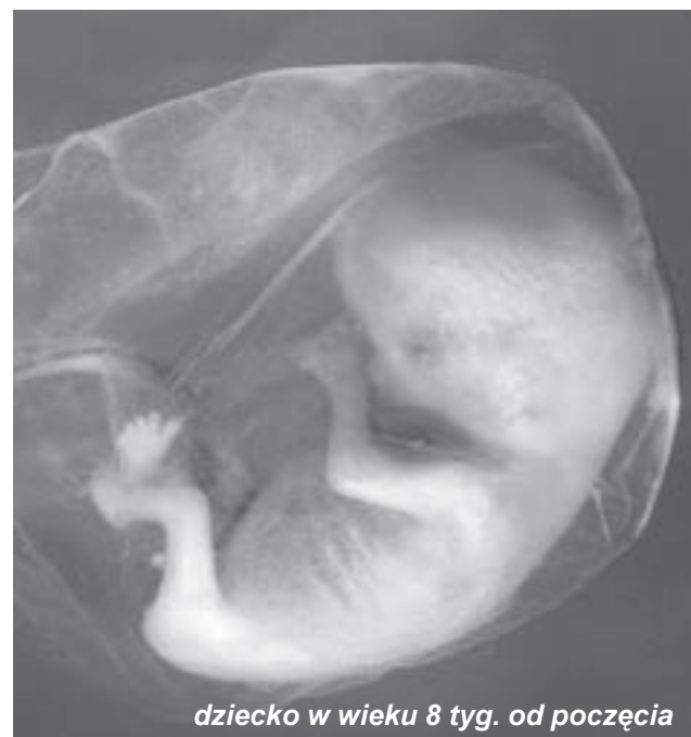
dziecko w wieku 8 tyg. od poczęcia

Opisywane placówki oferują pomoc rodzicom, których nienarodzone dziecko jest nieuleczalnie chore i prawdopodobnie umrze wkrótce po porodzie. Opieką objęta może zostać cała rodzina, oprócz rodziców – rodzeństwo, a nawet dziadkowie. Z pomocy takich hospicjów korzysta coraz więcej rodzin. Pod specjalistyczną opieką lekarzy, pielęgniarek, psychologów i duchownych, przygotowują się do dobrego przeżycia tych kilku godzin albo dni z umierającym noworodkiem.