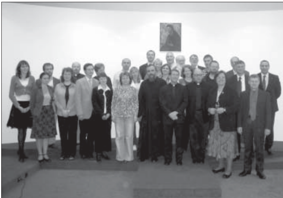
Pamiątkowe zdjęcie ze spotkania przedstawicieli Human Life International w Warszawie

Wspominamy go jako niezwykle serdecznego Ojca, który zawsze życzliwie wspierał wszystkie inicjatywy obrony życia i rodziny.