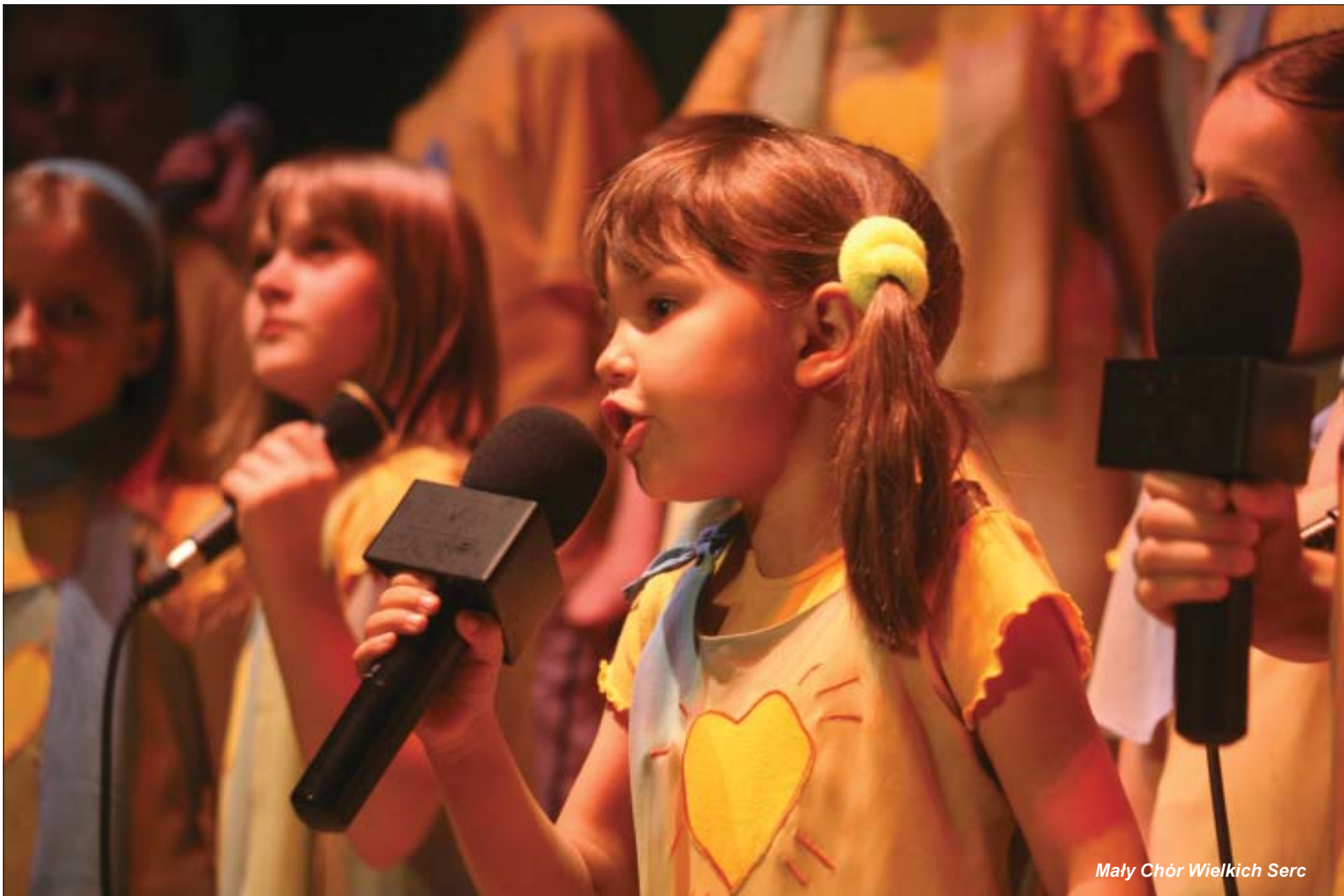
Mały Chór Wielkich Serc