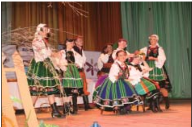
Oczepiny – zespół taneczny Instytutu Kulturoznawstwa PWSZ z Ciechanowa

Dla wielu osób wspólne przeżywanie Mszy świętej w Sali Kongresowej Pałacu Kultury i Nauki, który przez lata był symbolem potęgi ateizmu, było wielkim przeży-