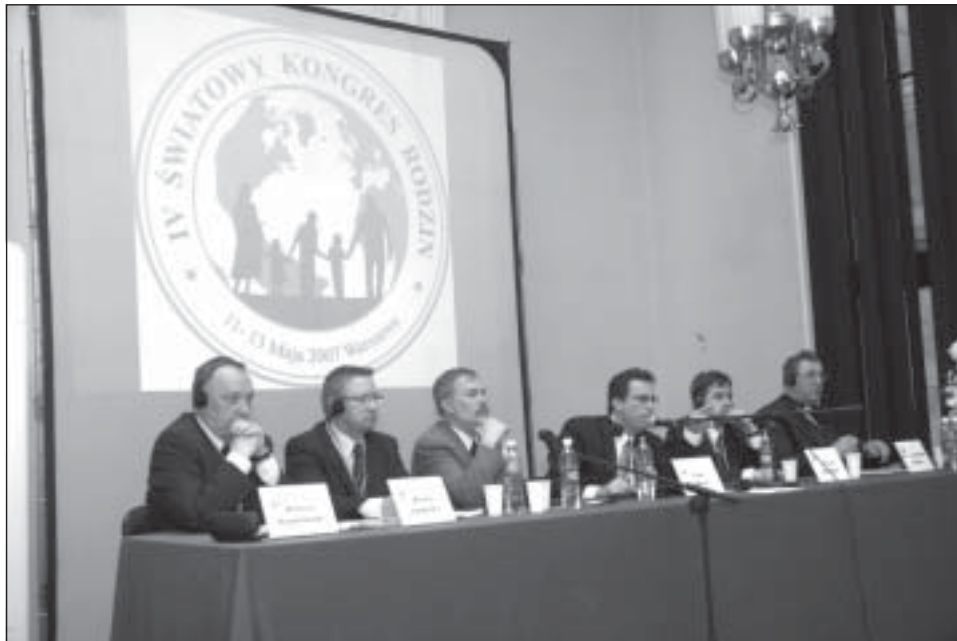
Jeden z paneli dyskusyjnych podczas kongresu

Podczas forum odbył się panel dyskusyjny Rodzina w