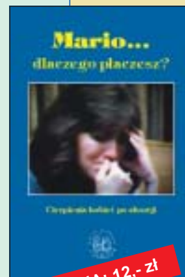
„Mario... dlaczego płaczesz?”

Seryjna, kolorowa wkładka informacyjna poświęcona poszczególnym zagadnieniom dotyczącym początków życia człowieka. Przeznaczona do wpinania do skoroszytu.